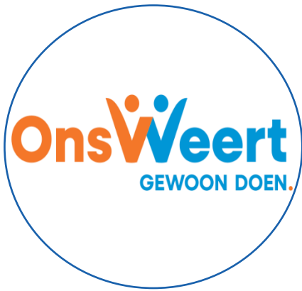
OnsWeert Sven de Loijer